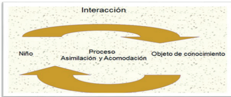
Cuadro # 1 Interpretación del proceso de aprendizaje de Jean Piaget

De acuerdo al postulado de Piaget (2007), se describe de manera sistemática el desarrollo cognitivo humano: parte del funcionamiento biológico del niño y su interacción con el objeto de aprendizaje. Esto lo conducirá al desarrollo de etapas progresivas hasta lograr el desarrollo intelectual constituido por formas superiores y complejas de razonamiento abstracto, propios de un adulto. Durante este proceso la acción transformadora permitirá la asimilación de nuevas experiencias que se acomodarán a la estructura cognitiva.