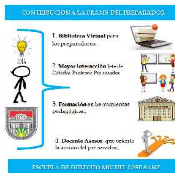
Figura 3. Representación gráfica de la contribución a la praxis del preparador.

También forma parte del norte de esta investigación, revelar fenomenológicamente las reflexiones que hacen los preparadores en torno a estrategias que deben implementarse para potenciar la planificación académica en ese grupo de docentes noveles. En tal sentido, de las entrevistas semiestructuradas aplicadas, se desprenden cuatro propuestas, destinadas a desarrollar la riqueza de estos estudiantes que deciden iniciarse en el compromiso de la docencia universitaria. A los fines de rigor, el investigador se permite presentar una gráfica, para ilustrar las contribuciones emergentes, previo a explicitar su contenido y valorar su importancia.