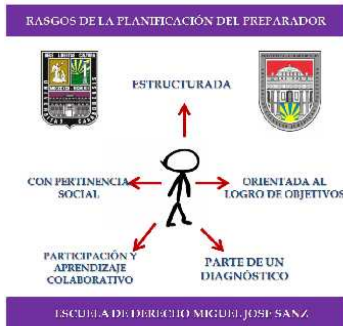
Figura 1. Representación gráfica de los rasgos de la Planificación del Preparador.