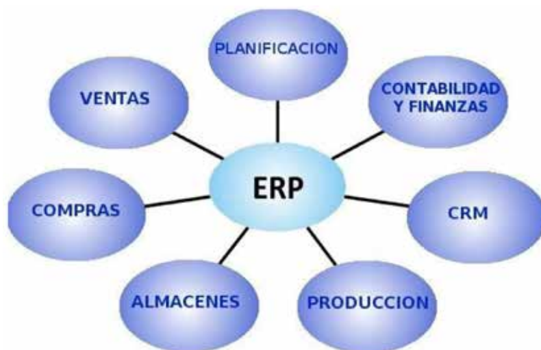
Figura 1. Módulos de ERP